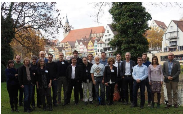
Kick off in Tübingen: „switchBoard – In the Eye of the Observer: Visual Processing at the Heart of the Retina“

SwitchBoard receives funding from the European Union's Horizon 2020 research and innovation programme under the Marie Skłodowska-Curie grant agreement No 674901.